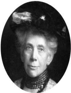
CHRISTINE LADD- FRANKLIN