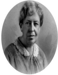
MARY WHITON CALKINS