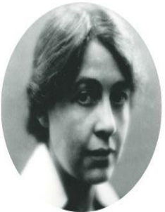
LETA STETTER HOLLINGWORTH