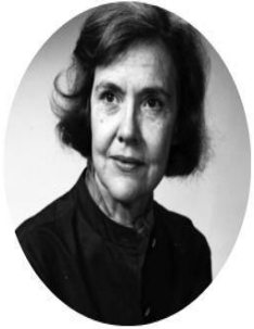
MARGARET FLOY WASHBURN